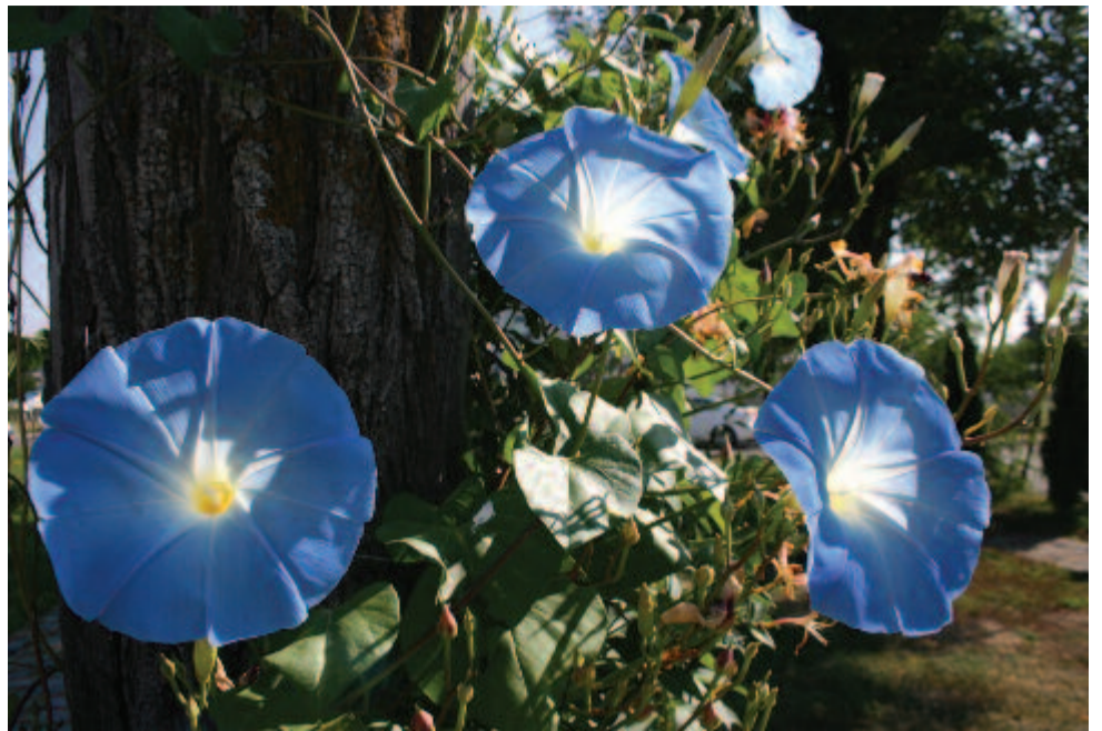
Búzavirágkék délignyilók marosszentgyörgyi sós fürdői kánikulában

Ugyanez a nap, 149 éve, 1868-ban született az etnográfus és zoológus kutató Fenichel Sámuel Nagyenyeden. 1892 novemberétől 1893 nyaráig Új-Guineában kutatott. Több