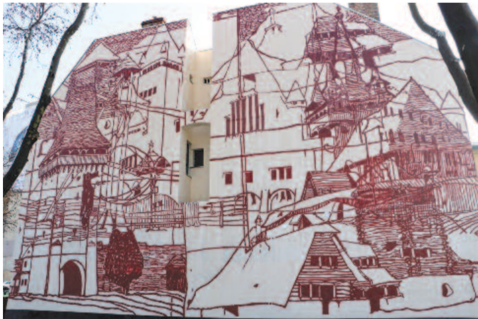
Az óbudai református parókia tűzfalfestménye

Kelt 2017-ben, szűz havának kezdetén, a VII. Bolyais Világtalálkozó kezdőnapján